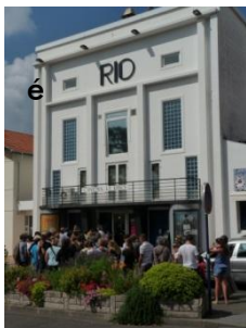
Cinéma Le Rio Allées Marines

Une séance au cinéma municipal Le Rio qui propose tout l'été une sélection quotidienne de films en qualité numérique.