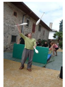
M.O.P 54 56 Rue du G. De Gaulle

Tous les jeudi matin le jardin de la Maison de l'Oralité et du Patrimoine vous ouvre ses portes pour des activités culturelles variées.