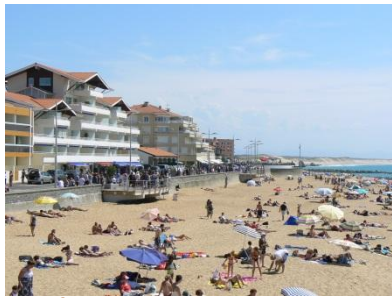
Le front de mer