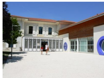
Médiathèque L'Écume des jours Place Yan-du-Gouf

Un petit détour par la médiathèque L'Écume des jours qui propose un fonds de 50 000 livres, CD, jeux à disposition de petits et des grands.