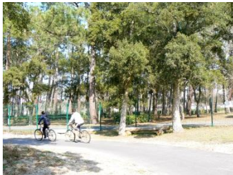
Ballade en forêt